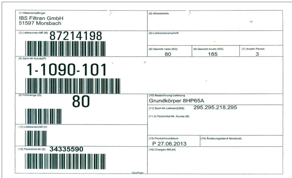
Abbildung 3: Barcode-Label nach VDA 4902

Der Warenanhänger ist deutlich sichtbar aufzubringen. Durch die Kennzeichnung müssen die Benennung und die Sachnummer erkennbar sein. Auf allen Ladeeinheiten ist dieses Etikett stirnseitig oben links anzubringen. Alle Informationen auf dem VDA-Warenanhänger wie auch der Barcode müssen lesbar sein und dürfen nicht durch Sicherungsbänder verdeckt werden.