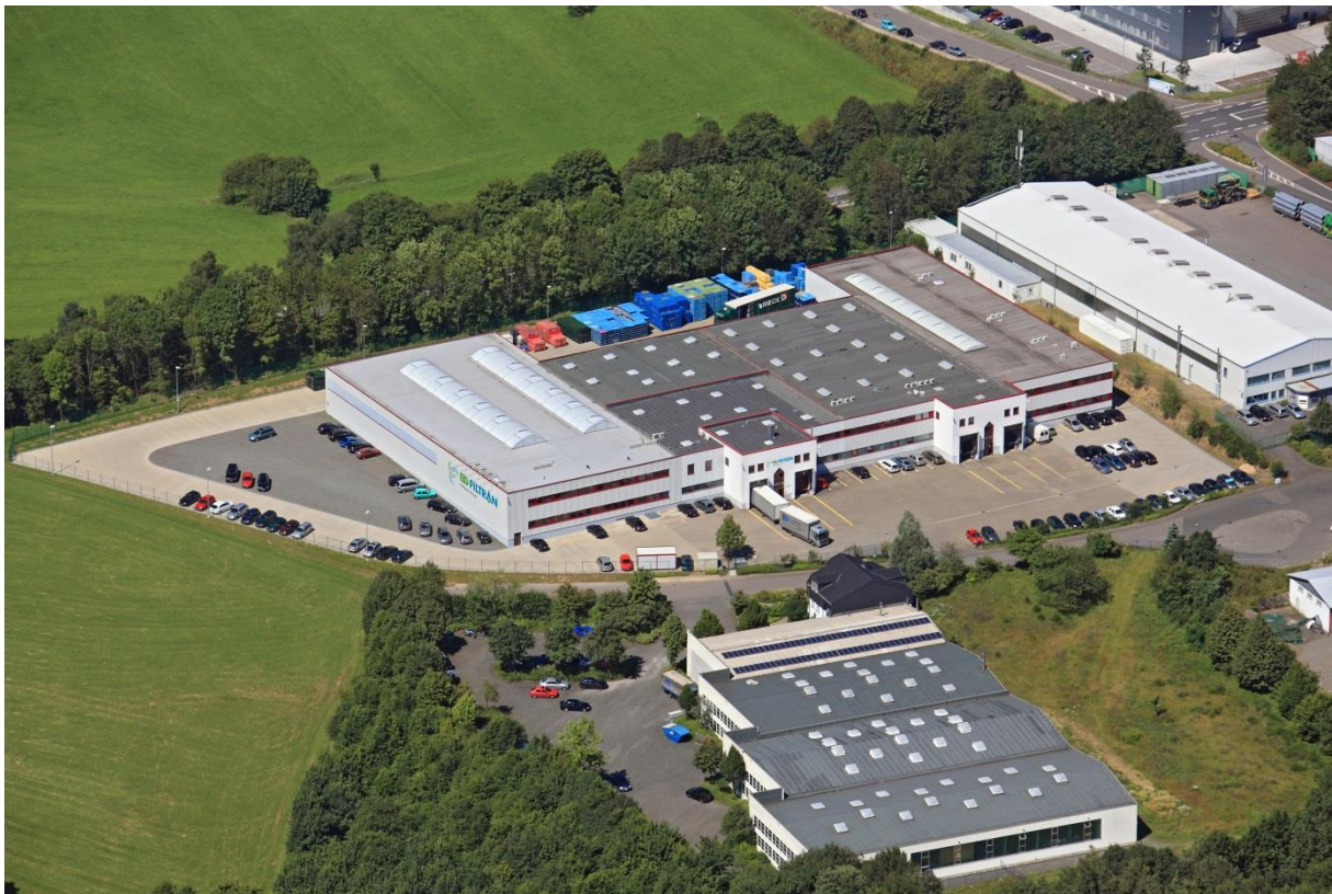
Abbildung 1: Firmengelände IBS FILTRAN GmbH

Diese Logistikrichtlinie soll helfen, die Lieferbeziehungen zwischen dem jeweiligen LIEFERANTEN und IBS FILTRAN zu standardisieren, um Reibungsverluste zu minimieren sowie ein gemeinsames Prozessverständnis zu erzeugen.